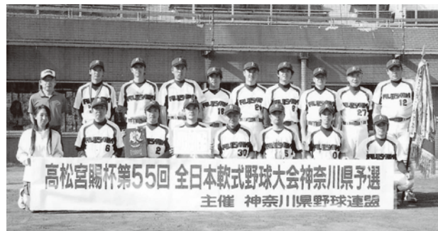
全国大会出場の藤沢市役所野球部

私たちが、藤沢市役所の職員をメン バーとする藤沢市役所福利厚生会野 球部と申します。 この度、周囲の多くの方のご協力、ご 支援をいただき、高 松宮賜杯第55回全 日本軟式野球大会 に出場させていただきました。 この場をお借りして、 改めてお礼と感謝を 申しあげます。 私たちの野球部は 創部60余年を数え、 数多くのOBと20歳 代から40歳代で構成 する歴史と伝統のあ る部です。社会人の アマチュア野球ですの で、言うまでもなく仕 事が中心であることは間違いありませ んが、昼休みや就業後の限られた時間 を有効に活用し、日々の練習に励んで おります。 今回出場した、高松宮賜杯第55回 全日本軟式野球大会は、我々としては 5年ぶりの全国大会出場であり、予選