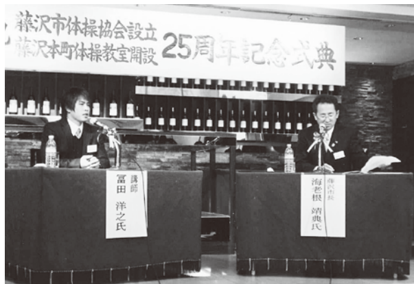
海老根靖典市長と富田洋之氏との対談風景

市体操協会の活動は細々としたこれまでの25年間でしたが、これからの活動は、子どもたちの体力向上と運動感覚づくり」に主力を注いで参ります。今後ともご支援のほどよろしくお願い申し上げます。(栗原)