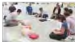
熱心に受講する皆さん

講習会には31名の体協関係者が参加する中、心肺蘇生法の大切さ、AEDの取扱い方法、気道異物除去法、回復体位、止血法等救急患者を救う一次救命処置について、具体的に実演を交えてご指導いただきました。(平山)